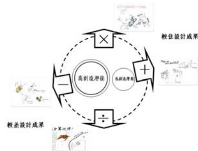
圖 4 成員組成與設計成果之關係

造成員，在經過討論的激盪後，可能產生加乘效果，亦可能產生相減甚至相除的效果，以本研究的例子來說，組別 C 獲得最佳的效果，組別 H 次之，這兩組產生較佳的加乘效果。而組別 A 與組別 D 在相似的成員組成下卻產生較差的結果，尤其是組別 A 之設計成果得到最低分的評價(圖 4)。