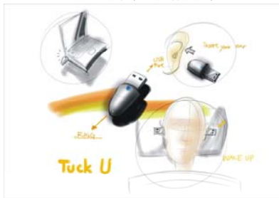
圖 3 設計概念呈現

在數位媒材方面運用 Wacom 手寫螢幕（圖 2），並搭配 Alias Sketch Book Pro 2.0 軟體，將此種數位型式的編輯方法導入概念設計階段（圖 3）之中。並且全程讓設計者僅使用數位筆進行，模擬傳統草圖之情境。