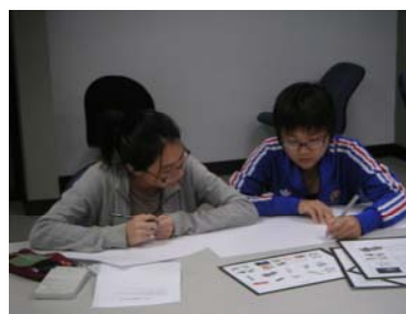
圖 1 設計討論過程

由於本實驗運用了傳統與數位兩種媒材，因此在題目的選定上格外重外，除了讓參與者可以在限定的時間內完成外，題目必須讓參與者有寬廣的想像空間得以發揮，並且在傳統與數位媒材中，必須以有所相似度，但在設計過程上又有所區隔為主。因此運用傳統媒材的題目為『防身用隨身碟』，與運用數位媒材的題目為『叫我起床隨身碟』。為避免媒材與題目先後產生的影響，在十組設計團隊中交叉使用兩種媒材。