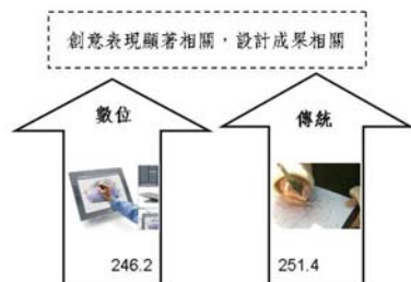
圖 6 運用不同媒材設計成果評鑑之關係

現在於其他層面中，並且傳統媒材在設計成果的平均分數略高於數位媒材(圖 6)，顯現兩者之間仍存有一定的差異，但對於設計創意的表現上並不會造成影響。