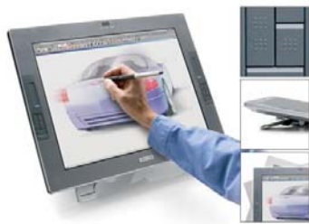
圖 2 數位手繪系統